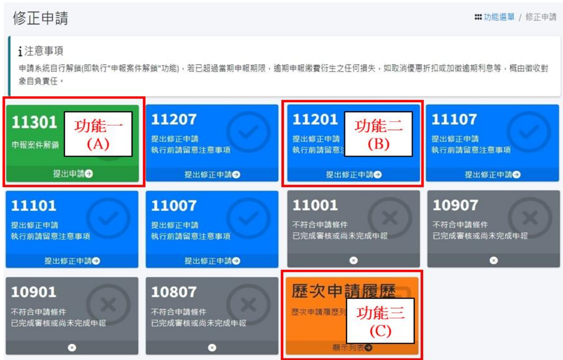
圖3.1-2 各期申報案件狀態

進入修正申請專區後，系統畫面顯示 5 年內各期申報案件狀態(如圖 3.1-2)，系統將依各期申報、繳費、審核情形判定適用修正類別。本專區功能包含「申報案件解鎖」、「提出修正申請」及「歷次申請履歷」三大功能，適用對象及注意事項如表 3.1。