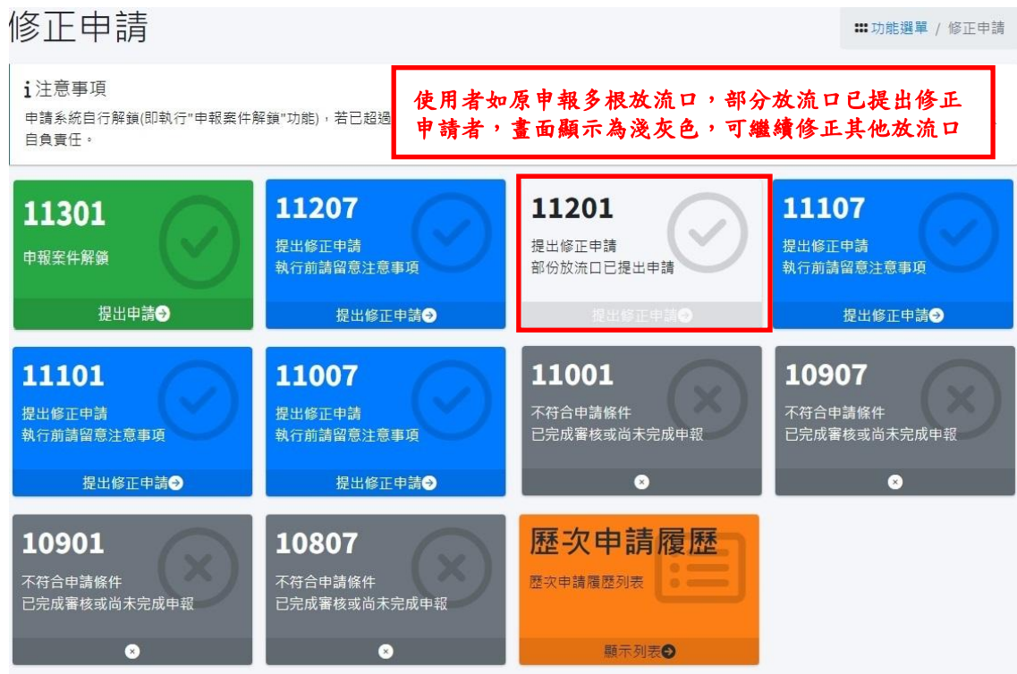
圖 3.1-10 多根放流口之事業提出修正申請後頁面