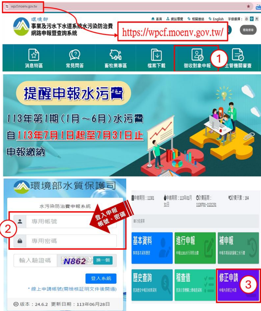
圖 3.1-1 水污費申報專區登入說明

進入水污費申報系統首頁，網址為： https://wpcf.moenv.gov.tw/ (系統操作環境：建議以 IE9 以上、Firefox、google chrome 等瀏覽器開啟)，首先點選首頁「徵收對象申報專區」選項；進入帳號密碼登入頁面，依照畫面輸入使用者帳號及密碼登入；輸入使用者帳號及密碼，點選「登入申報系統」，即進入「水污費申報專區」功能選單，再選取「修正申請」功能(畫面如圖 3.1-1)。